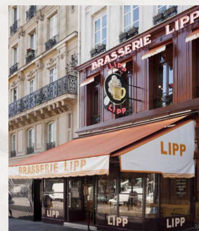
La brasserie LIPP

En quelques années, le prix Cazes est devenu "l'événement littéraire du printemps" (contrairement aux autres grands prix, remis à la rentrée) qui mobilisait le monde littéraire et journalistique parisien.