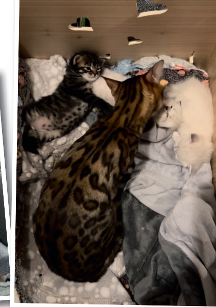
Scarlett au milieu des trois bébés Sibériens: Umberto, Ulrich et Usbek de la Rue du Dragon