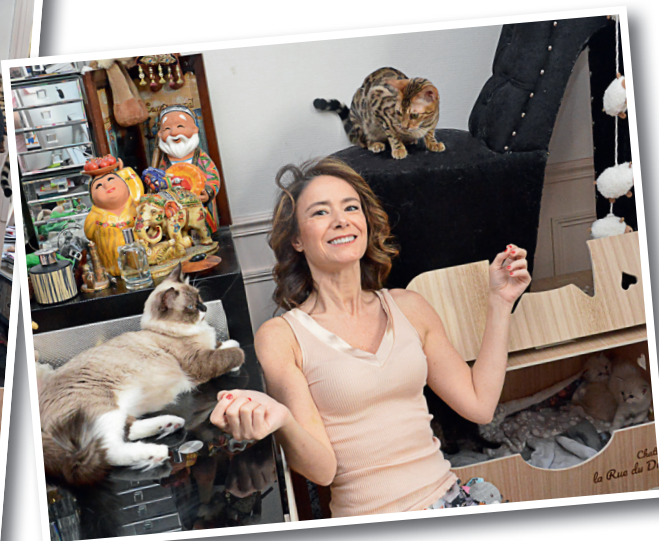
De quoi crier victoire !