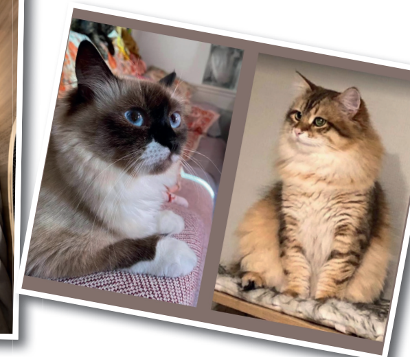
Gloria et Sultan, les parents de ces jolis chatons

ou juristes) venir chacun dispenser 4 heures de cours dans son domaine d'expertise: nutrition, droit et réglementation, génétique et sélection, logement santé et transport animal, reproduction, Comportement. Le niveau des enseignements m'a impressionnée. La génétique surtout était si pointue que je me disais que je ne réussirais jamais l'examen! Or les 30 questions de l'examen (il faut avoir au minimum 18/30 pour obtenir l'ACACED) sont beaucoup plus faciles.