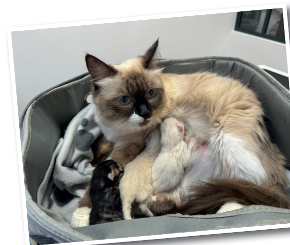
Gloria et ses trois bébés