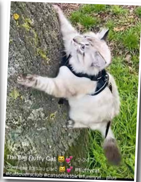
Usbeck, seal tabby point