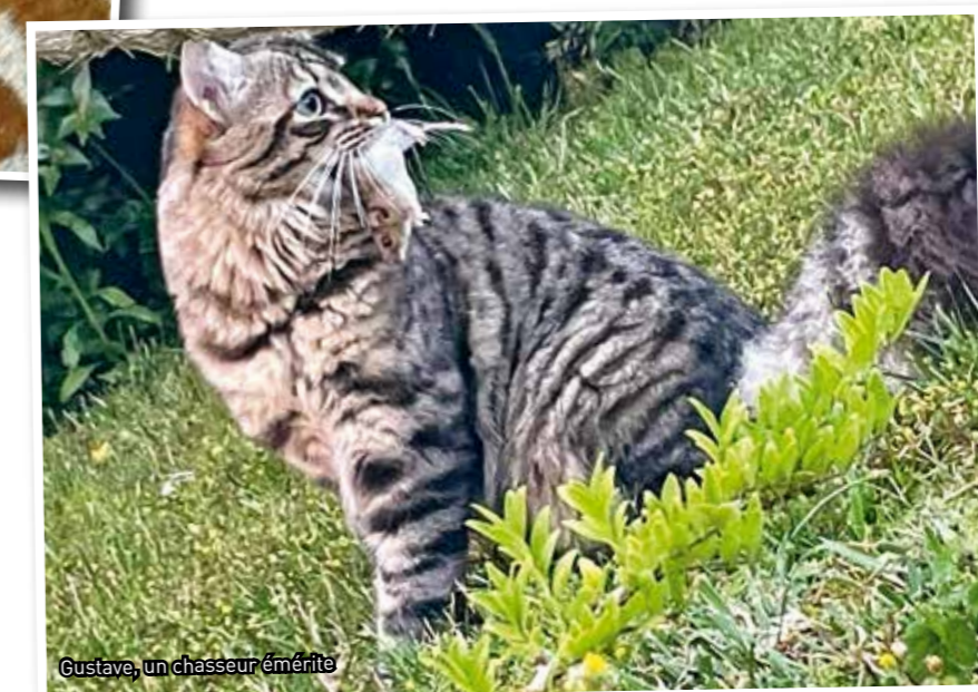
Gustave, un chasseur émérite