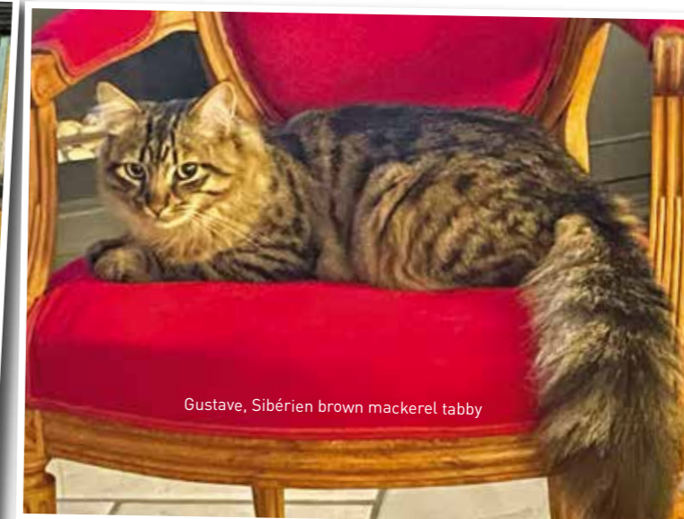
Gustave, Sibérien brown mackerel tabby