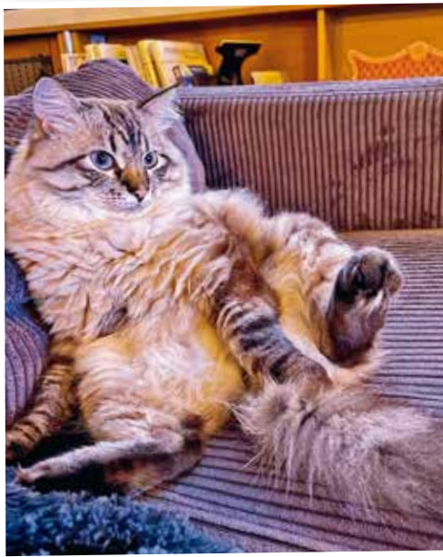
Usbek assis comme un pacha