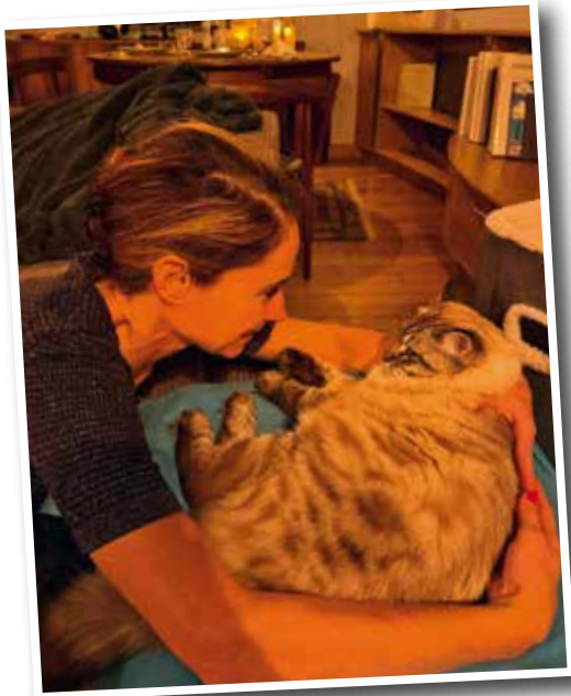
Dialogue entre Usbek et Guilaine