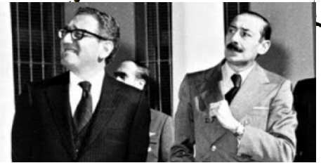
L'ancien Secrétaire d'État étasunien Henry Kissinger et le dictateur argentin Jorge Rafael Videla

Le plan Condor, déclenché en novembre 1975, instituait un pacte secret de coopération criminelle anticommuniste et contre-révolutionnaire entre les dictatures du Chili, de l'Argentine, du Brésil, de la Bolivie, de l'Uruguay et du Paraguay, avec le concours de la CIA et orchestré par le controversé Henry Kissinger , prix Nobel de la Paix 1973... On estime le nombre de victimes à un demi-million de personnes sur le continent sud-américain.